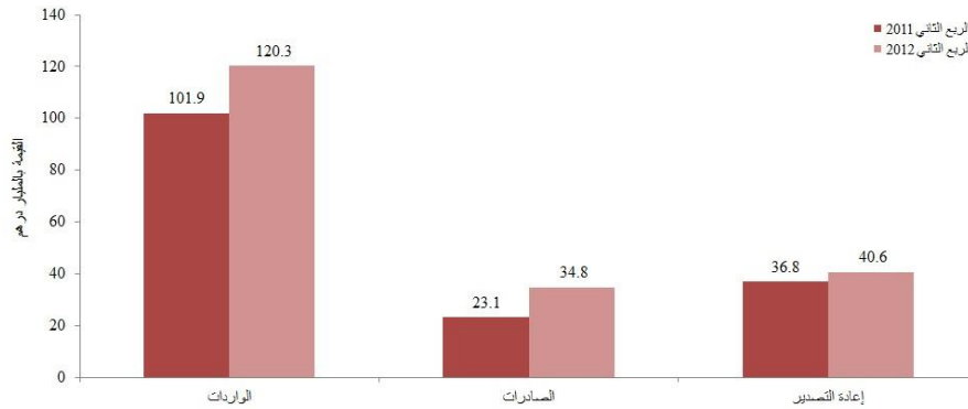
شكل (1) | التجارة الخارجية المباشرة للربع الثاني 2011 - 2012